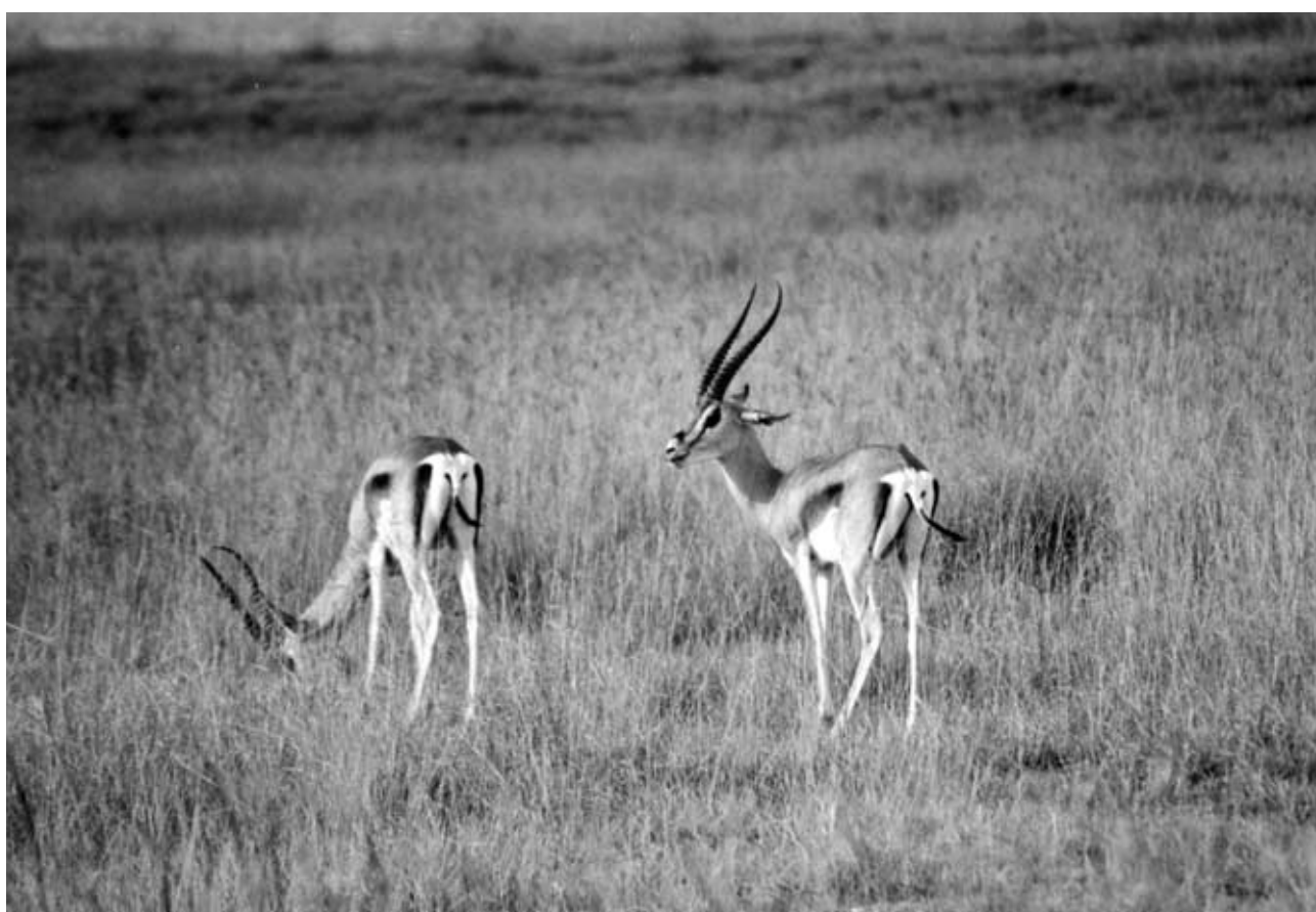
Natur, Landschaft und Tiere: Frei lebende Antilopen

! Vor kurzem haben wir während einer Klausursitzung mit Schulen über diese Frage diskutiert. Die meisten Argumente hätten sich auf jede Nord-Süd-Schulpartnerschaft beziehen können. Die Lehrerinnen und Lehrer wollen die Idee von einer Welt, in der viele unterschiedliche Kulturen und Menschen miteinander in Frieden leben, in den Unterricht bringen. Im Unterricht und in verschiedenen Projektformen wollen sie