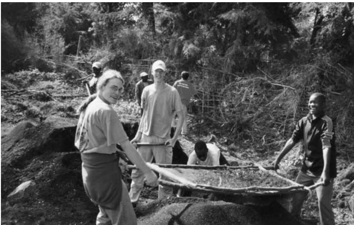
... Vorbereitung einer Baumpflanzung und ..

Das Haus hat Symbolcharakter: Die Wände sind zwei Halbrunde und bilden in der Aufsicht einen Kreis, der auseinander geschnitten und verschoben