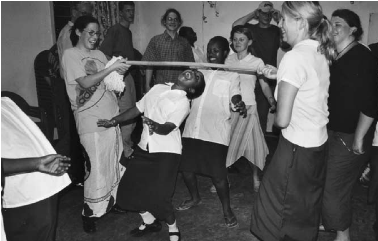
Annäherung: gemeinsame Spielabende . . .