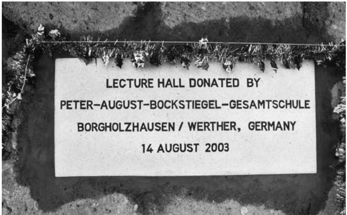
... Einweihung der Lecture Hall und ...

terricht zu erstellen. Sie sollen nicht nur in der eigenen Schule eingesetzt werden, sondern auch weiteren Schulen zur Verfügung gestellt werden. Die am Austausch beteiligten Schülerinnen und Schüler werden an der Herstellung der Unterrichtsmaterialien maßgeblich beteiligt. Nach der Fertigstellung werden sie Teile davon in der eigenen und in anderen Schulen vorstellen. Die Materialien werden übrigens auch für Sponsorenwerbung genutzt. An der Ausformulierung und Erstellung der Unterrichtsmaterialien arbeiten die Fachgruppe Englisch der Schule und die entsprechende Fakultät der Universität Bielefeld mit.