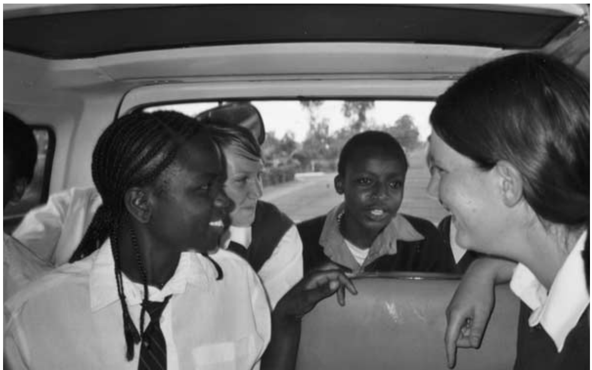
... gemeinsam beim Ausflug

Die Grundlage für die unterrichtliche Einbindung bildet zunächst der gesamte Themenfundus, der sich aus der Beschäftigung mit dem Zielland der Schul-