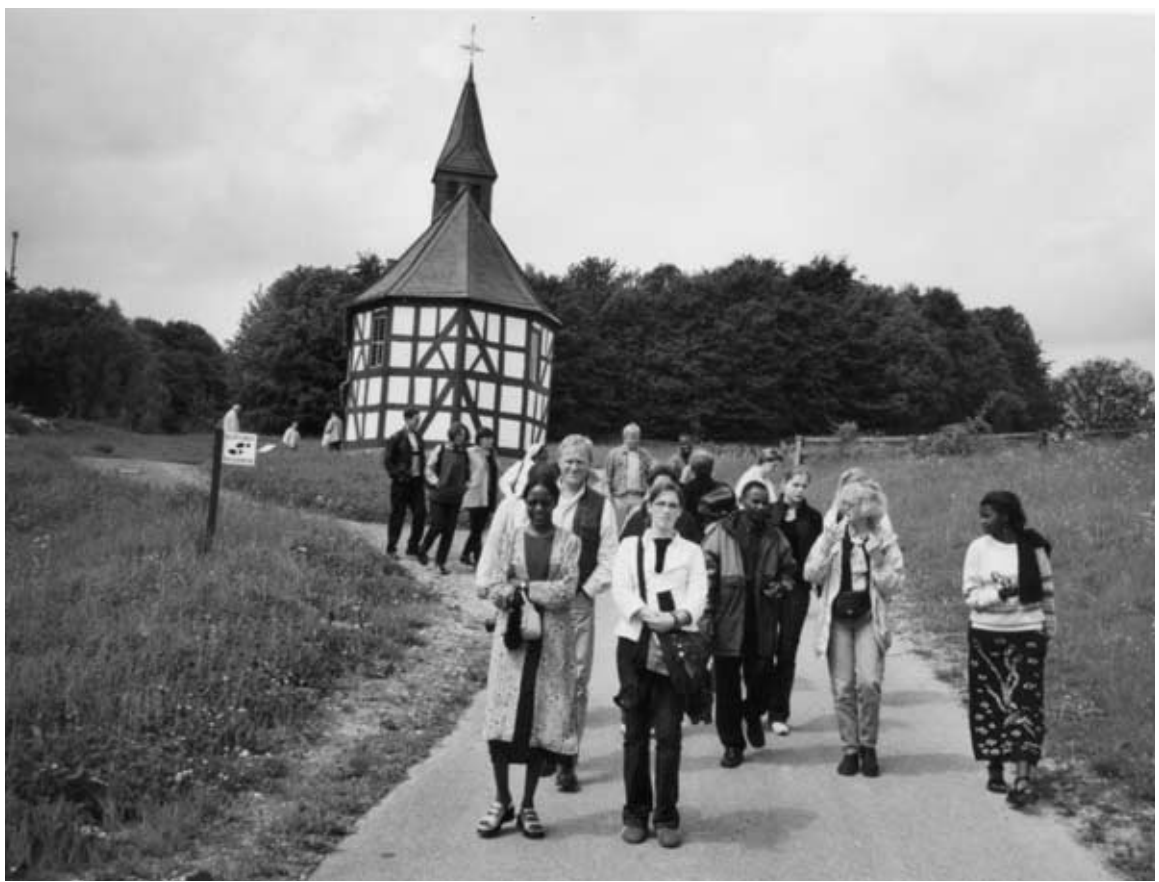
Gemeinsamkeiten: Bauernhausmuseums in Detmold und ...

Die Verantwortung für die Schulpartnerschaften liegt sehr oft in den Händen einzelner Personen oder einer kleinen schulischen Arbeitsgruppe, die manchmal durch den einen oder anderen externen Helfer unterstützt wird. Die Einbettung einer Schulpartnerschaft in das Schulprogramm oder eine analoge institutionelle Verankerung sind in der Durchführung eher die Ausnahme. Viele engagiert und zeitintensiv aufgebauten Schulpartnerschaften bleiben auf diese Weise