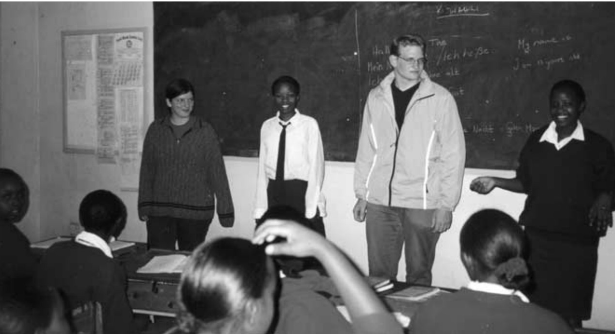
... während des Unterrichts

sten. Die Medikamente kommen weitgehend vom deutschen Hilfswerk „action medeor“. Alle Schülerinnen und Schüler tragen Schulkleidung, wie es in Kenia allgemein üblich ist. Für das Selbstwertgefühl der Kinder ist es sehr wichtig, nicht wie „Lumpenkin-der“ herumzulaufen, sondern wie die Kinder reicher Eltern Schulkleidung zu tragen. Die Kleidung wird weitgehend im Zentrum genäht und gestrickt.